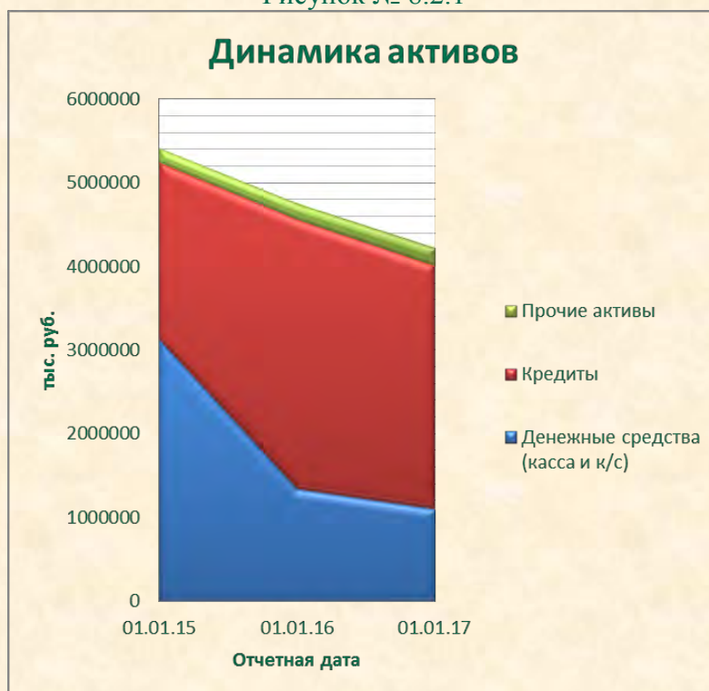
Рисунок № 8.2.1

Количество работающих счетов, открытых корпоративным клиентам по состоянию на 01.01.2017, составляет 1101, что на 1,7% меньше, чем по состоянию на 01.01.2016. Количество счетов, открытых частным клиентам по состоянию на 01.01.2017, составляет 2953, что на 13,7% меньше, чем по состоянию на 01.01.2016. Уменьшение количества открытых счетов обусловлено проведением в Банке с 2015 года плановых мероприятий в части закрытия счетов на основании ст. 859 ГК РФ, закрытием счетов клиентов, исключенных из ЕГРЮЛ, а также общим снижением экономической активности клиентов.