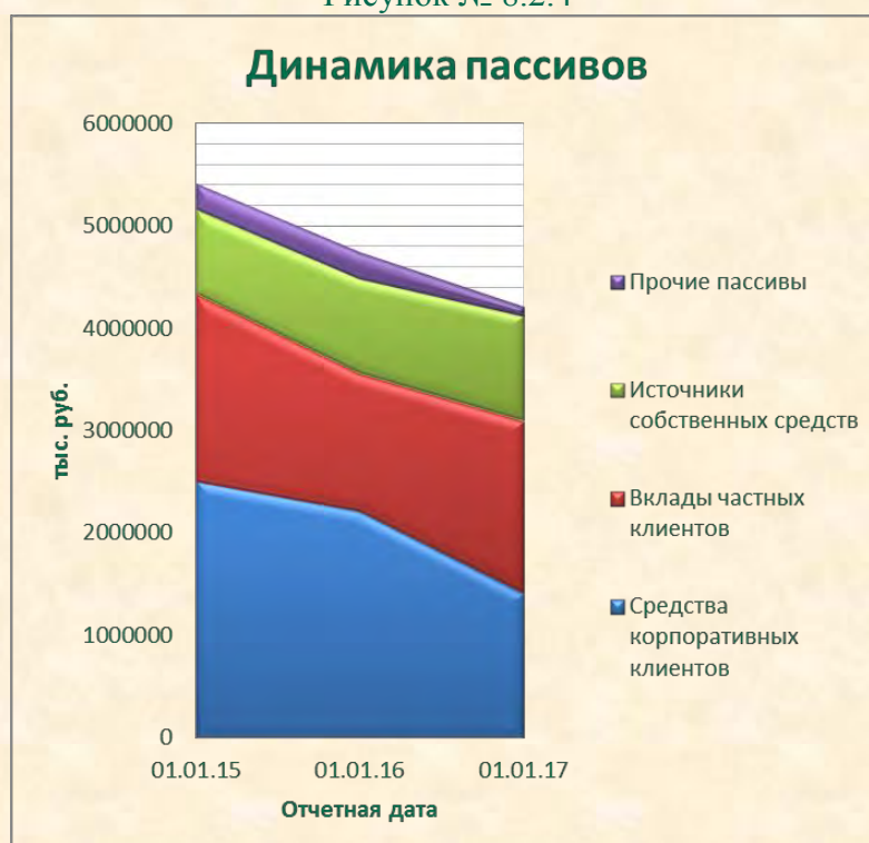
Рисунок № 8.2.4

Объем привлеченных средств клиентов, не являющихся кредитными организациями, за год уменьшился на 17,97 % с 4 340 512 тыс. руб. до 3 560 419 тыс. руб. При этом уменьшилась доля средств, привлеченных от физических лиц, относительно 2014 г. на 27,84% с 1 788 416 тыс. руб. до 1 290 574 тыс. руб., а средства корпоративных клиентов уменьшились на 11,06% с 2 552 096 тыс. руб. до 2 269 845 тыс. руб.