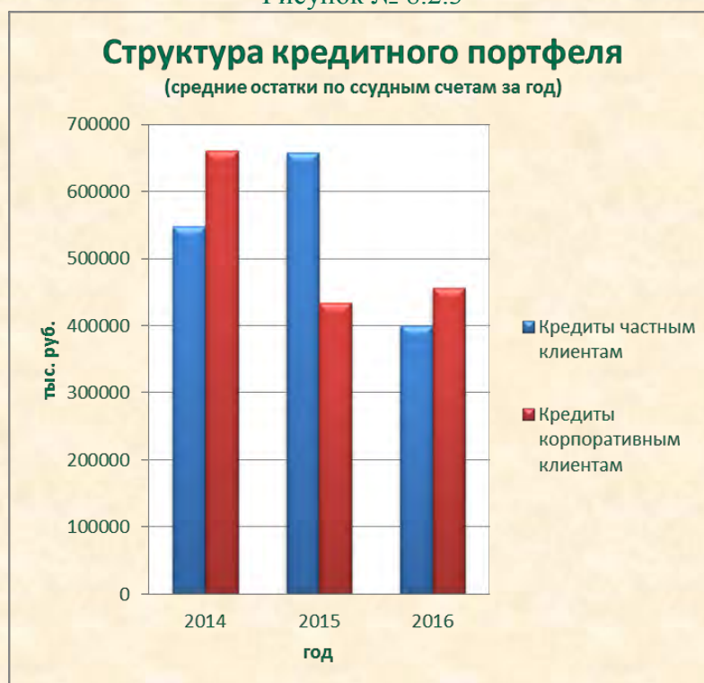
Рисунок № 8.2.3

Объем привлеченных средств клиентов, не являющихся кредитными организациями, за год уменьшился на 17,97 % с 4 340 512 тыс. руб. до 3 560 419 тыс. руб. При этом уменьшилась доля средств, привлеченных от физических лиц, относительно 2014 г. на 27,84% с 1 788 416 тыс. руб. до 1 290 574 тыс. руб., а средства корпоративных клиентов уменьшились на 11,06% с 2 552 096 тыс. руб. до 2 269 845 тыс. руб.