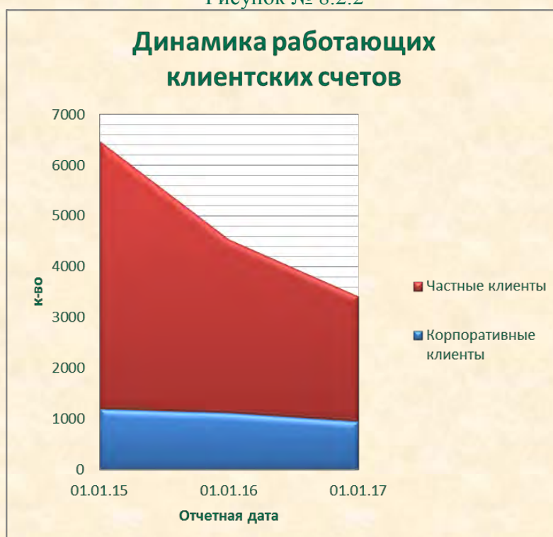
Рисунок № 8.2.2

Количество работающих счетов, открытых корпоративным клиентам по состоянию на 01.01.2017, составляет 1101, что на 1,7% меньше, чем по состоянию на 01.01.2016. Количество счетов, открытых частным клиентам по состоянию на 01.01.2017, составляет 2953, что на 13,7% меньше, чем по состоянию на 01.01.2016. Уменьшение количества открытых счетов обусловлено проведением в Банке с 2015 года плановых мероприятий в части закрытия счетов на основании ст. 859 ГК РФ, закрытием счетов клиентов, исключенных из ЕГРЮЛ, а также общим снижением экономической активности клиентов.