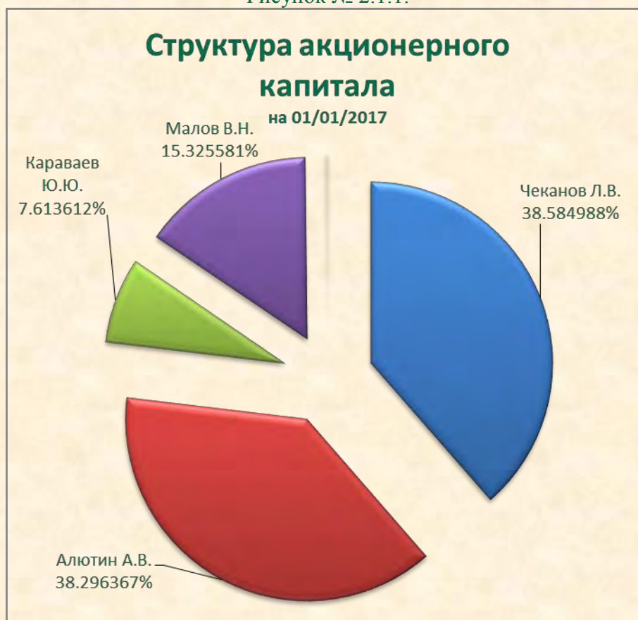
Рисунок № 2.1.1.